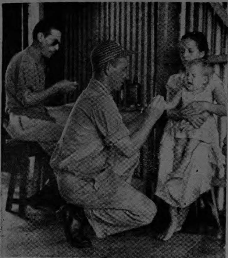
La labor sanitaria en los campos, realizada constantemente por los miembros del Departamento de Sanidad, ayuda en forma eficaz al programa de erradicación de la malaria en todo el continente.