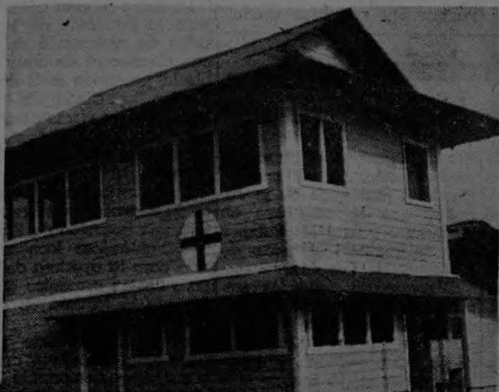
En Coto 52 se construyó el año pasado este moderno Dispensario. Está dotado de los servicios indispensables a un centro asistencial de su naturaleza.