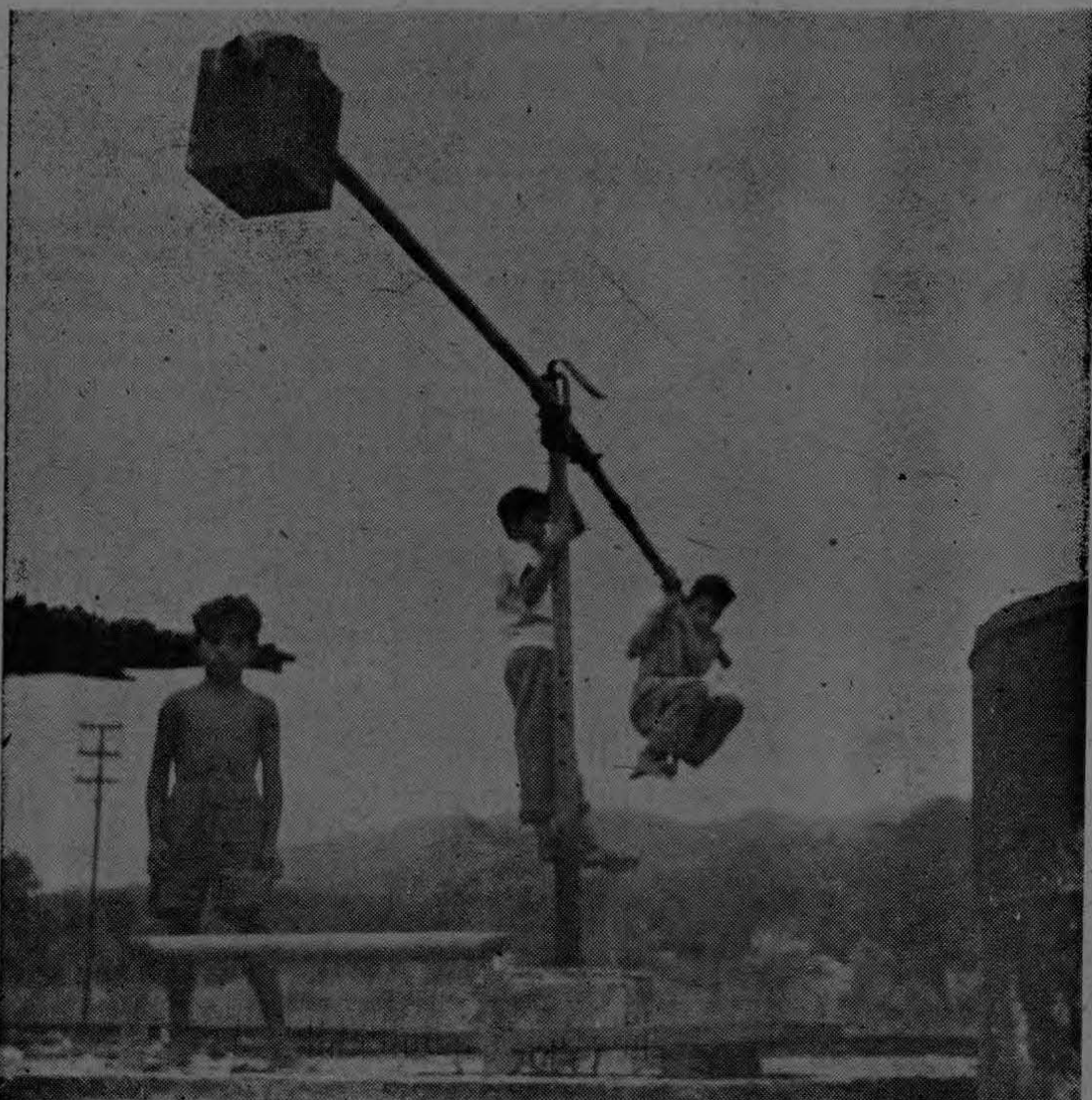
Este grupo de "güilas", en una de las fincas de la zona bananera, se divierte columpiándose en uno de los viejos lavadores de fruta que se están dejando en desuso. Por tres meses, ellos son los señores de la alegría y se les ve jugueteando por todas partes. En marzo, al reiniciarse los cursos escolares, volverán muy formalitos a ocupar su sitio en las aulas de estudio.