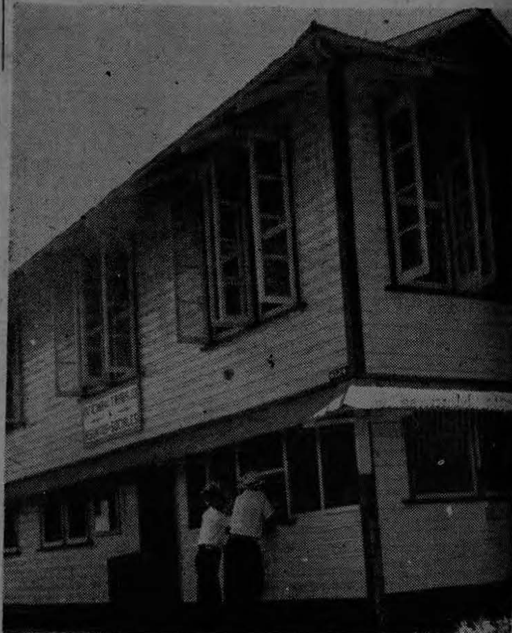
Las relaciones obreras se han mantenido con un mayor contacto entre los trabajadores y las oficinas especializadas que al efecto se han creado. Nuevos servicios han aumentado las buenas relaciones entre trabajadores y empresa.